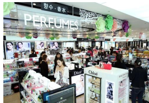
ロッテ免税店 仁川空港店

*1 韓国のプリペイド式交通カード。交通機関以外にも「T-money」加盟のコンビニや、一部コスメショップ(ETUDE HOUSE、THE FACE SHOP、TONYMOLY など)でも利用可能。