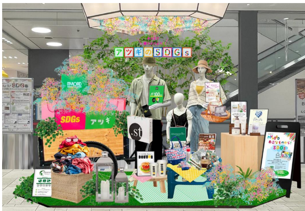
<身近なものから！SDGs 館内ディスプレイ（装飾）イメージ>

株式会社小田急SCディベロップメント（本社：東京都新宿区 取締役社長：細谷 和一郎）が運営する神奈川県厚木市の商業施設「本厚木ミロード」は、環境省が6月を「環境月間」に設定していることに合わせ、大人も子どももSDGsを楽しく学び、体感できるイベント・キャンペーン「6月はSDGs月間 ～身近なものから！SDGs～」を2024年6月1日（土）～6月30日（日）まで開催します。