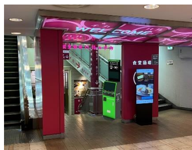
⑤設置場所（食堂酒場ハル★チカ入口）