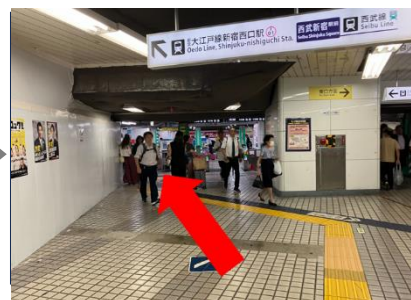
③新宿西口駅改札を左に曲がる