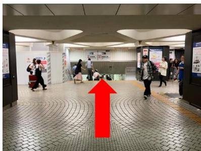
②東京メトロ線方向の階段を下る