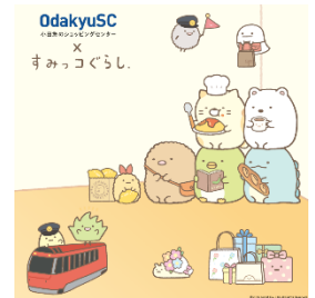
特大パネルイメージ

会場：① 新百合ヶ丘エルミロード：5Fエレベーターホール前 ② 本厚木ミロード：6Fレストランフロア