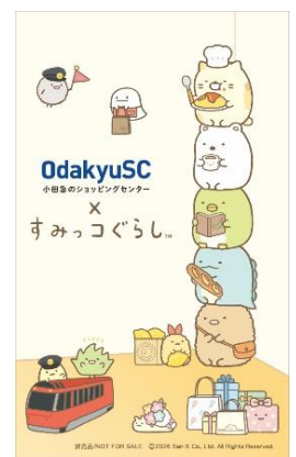
ステッカーイメージ

参加方法：対象の飲食店で1会計2,000円（税込）以上のご利用 & お会計時に 合い言葉「おかいものキャンペーン」と店舗スタッフにお伝えいただいた方に、 ステッカー1枚をプレゼントします。