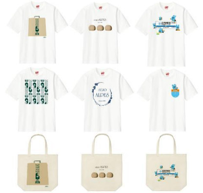
< 限定商品画像 (イメージ) >

商品名 : 成城石井、成城アルプス (成城地域コラボ) 限定デザインTシャツ&トートバッグ、 もころん (小田急電鉄子育て応援マスコットキャラクター) 限定デザインTシャツ&トートバッグ ※大人用サイズ : S、M、L、XL 子ども用サイズ (もころんコラボのみ) : 120、130、140 価格 : Tシャツ/大人用 : 1,990円 (税込)、子ども用 : 1,500円 (税込) トートバッグ/2,490円 (税込) 発売予定日 : 2026年4月10日(金)より 商品に関するお問い合わせ : ユニクロ 成城コルティ店 050-3101-6260 (受付時間 : 10:00～21:00)