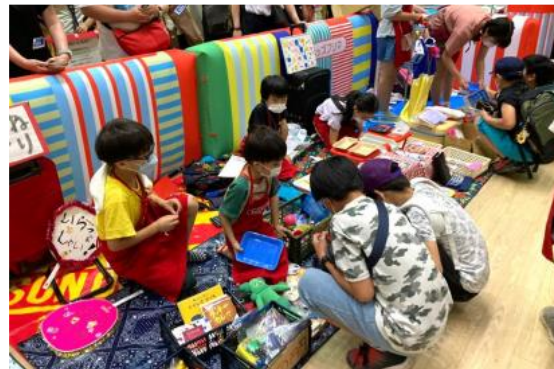
<キッズフリマイメージ（本厚木ミロードでの様子）>

* URL : https://www.odakyu-sc.com/so-ss/event/