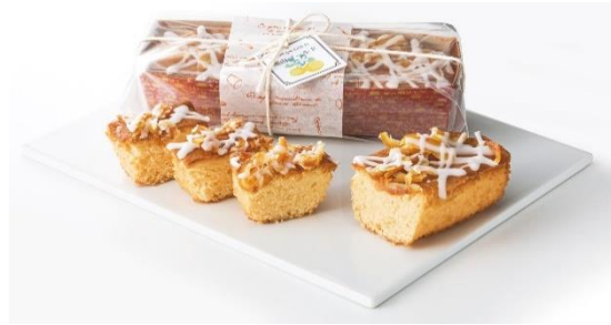
鎌倉小川軒 湘南 Gold Pound Cake 1,000円 (税込)