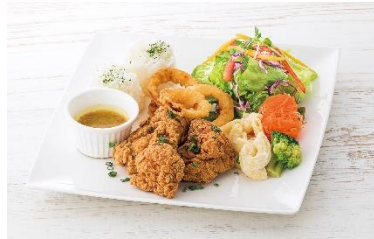
3F 湘南 Grill スタイル モチコチキンプレート 1,250円 (税込)

URL : https://www.odakyu-sc.com/shonan-gate/event/#2170