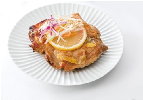
湘南 Grillスタイル チキン Grill 680円 (税込)