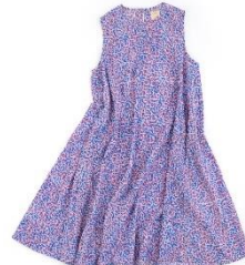
2F kapuwa 4周年限定ワンピース 16,500円 (税込)