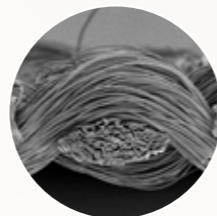
リサイクルPET繊維のトレシー断面写真

「高品位な再生資源」+「東レ独自の繊維製造技術」で、これまで困難であった、特殊な糸の生産を可能に。多様な断面や細さなど品種のバリエーションを増やしていくことで、さまざまなニーズに応える妥協のないものづくりに繋がっていきます。「トレシーお年賀クロス」もその一つなのです。