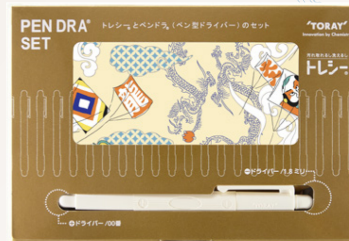
写真と実物では色が若干異なる場合がございますのでご了承ください