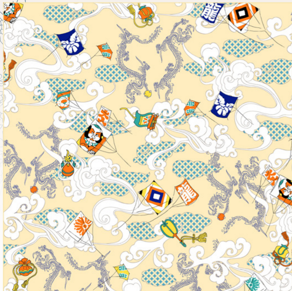
写真と実物では色が若干異なる場合がございますのでご了承ください

運気上昇を意味する「昇龍」と、天より満願成就の如意宝珠を持って舞い降りた「降龍」が、縁起の良い七宝模様の瑞雲の間を飛び回るデザインです。