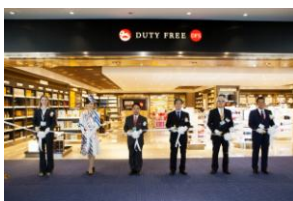
<リニューアルオープニングセレモニー>