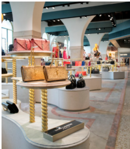
レディースファッションエリア