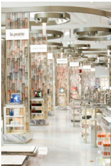
明るく広いビューティエリア