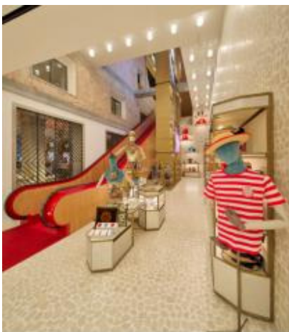
ヴェネツィアブランドの取り扱いも