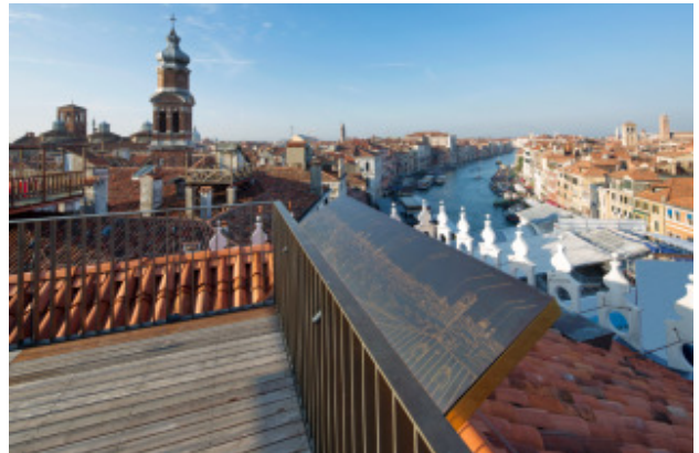
ルーフトップテラスから見渡すカナル・グランデ