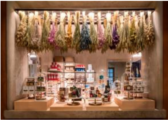
イタリアンギフト・フードを数多く取り扱う