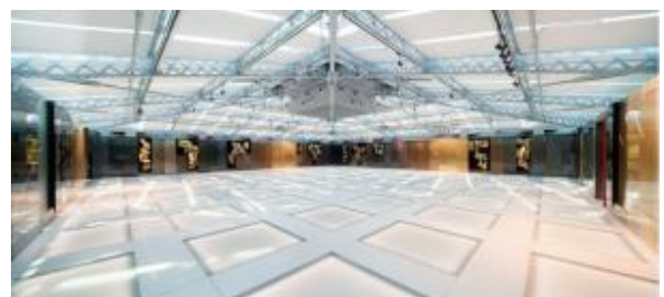
イベントパビリオンではビデオインスタレーション「アンダー・ウォーター」を開催中