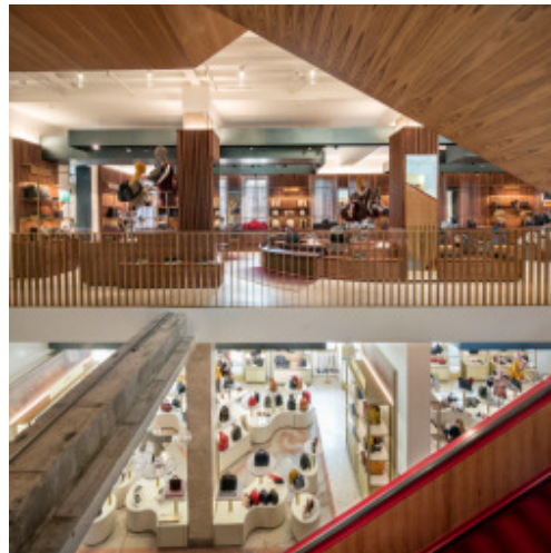
赤い色調のエスカレーターで繋がる各フロア

世界をリードするラグジュアリー トラベル リテラーであるDFSグループは、歴史の街 イタリア ヴェネツィアのカナル・グランデに面し、東洋と西洋の交易の中心として名を馳せた歴史的建造物の中に、Tフォンダコ デイ テデスキ by DFSを2016年10月1日（土）にオープンいたします。