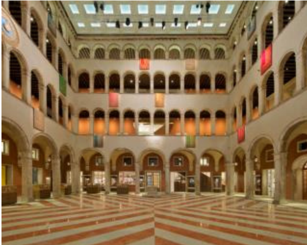
4フロアに渡り吹き抜け明るい店内

世界随一の都市、ヴェネツィアの豪華絢爛な歴史的建築物に ショッピング、カルチャー、エンターテイメントが集まった格調高いスポットが誕生