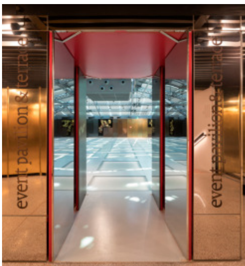
イベントやエキシビション等を行う 「イベントパビリオン」スペース