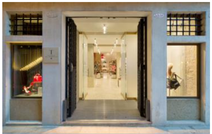
通りから見た「Tギャラリア フォンダコ デイ テデスキ」