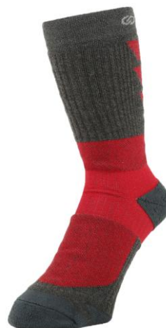
グリップサポートクルーソックス(チャコール)