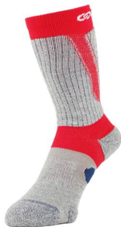
3DF アーチパネルダブルテーピングクルーソックス(レッド)

特に下り坂を歩行時、多くの方が感じていたつま先のアタリを軽減する設計を採用。特殊な滑り止め素材を足元の3ヶ所(つま先、かかと、 ほしきゅう 拇指球)に使用することにより、グリップ力を強化しました。また、歩行を安定させる「足首テーピング機能」も搭載しています。