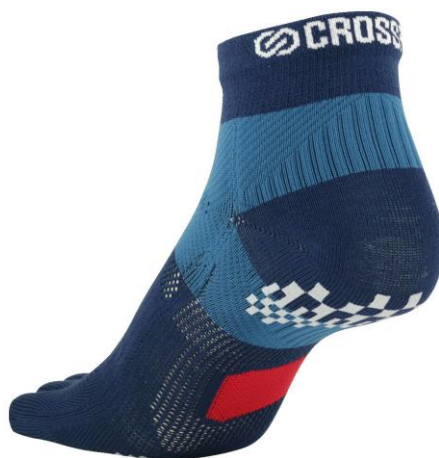
3DF アーチパネル薄手 5 本指ソックス(ネイビー)

足元のサポート機能をより強化するため、足の負担を軽減する「アーチパネル」に、今回は足首まわりをしっかり固定して走りやすくする「足首テーピング機能」を追加しました。さらに足底のグリップ力を強化する滑り止めと、フィット性のある 5 本指タイプを採用しています。