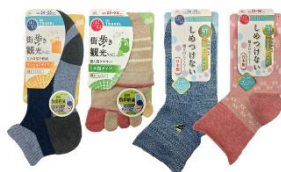
▲優秀作品：はくらくペア4足セット