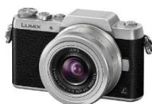
▲グランプリ：デジタル一眼カメラ