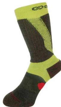
3DFアーチパネルダブルテーピングクルーソックス (チャコール)