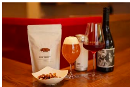
町の酒屋NEW VALLEYより、こだわりの一杯をご提供！