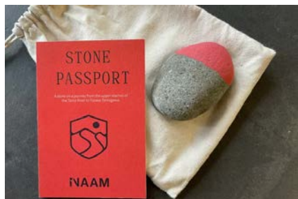
石が旅する。川と時間を感じるストーンアート

世田谷区による、エコバッグへのお絵描きやオリジナル缶バッジブレスレットづくり、みどり生き物に関する飛び出す絵本の読み聞かせ。