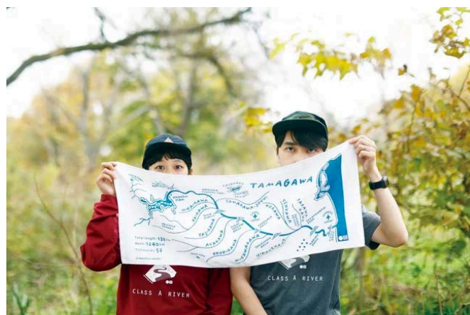
多摩川グッズストア