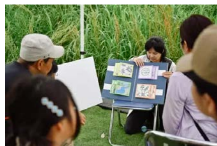
環境ワークショップ