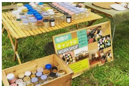
虫除けキャンドルワークショップ