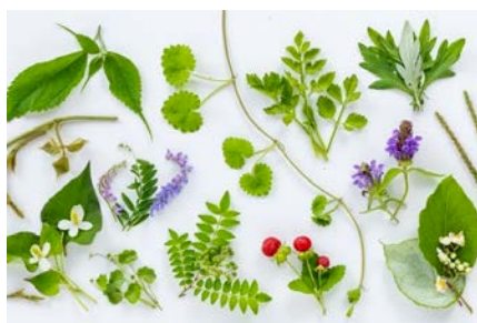
ビオトープつくろう！