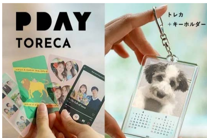
ネイチャーズデイ写真館

流域を描いた手ぬぐいやTシャツ、キーホルダーなど、多摩川を身近に感じるアイテムを販売。