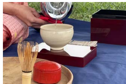
ピクニック茶会（野点）茶の湯サロン 耀庵