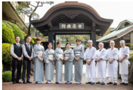
社員と家族の笑顔が生まれる職場づくりを目指す

入社から 3 年毎の節目に、社員・社員ご家族・ご親戚を無料で当館の宿泊に招待するプログラムです。社員・ご家族への感謝の気持ちを形にするとともに、かねてより進めている社員の働きやすい職場環境づくりをさらに前進してまいります。