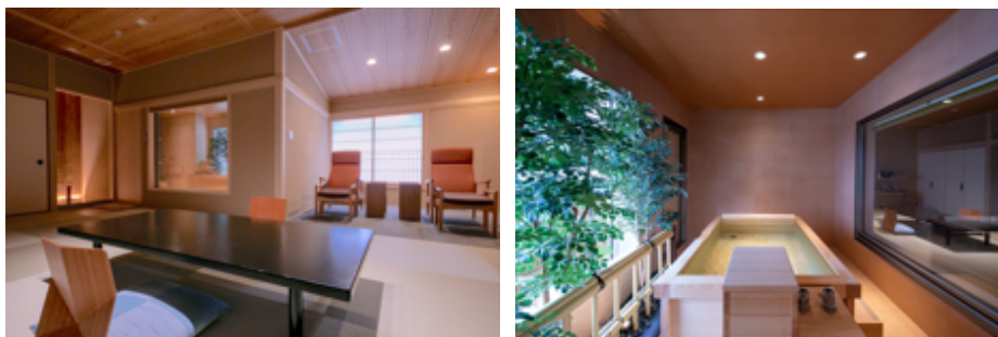
特別室や高額プランも含めてプログラムの対象に

https://atami-furuya.co.jp/recruit/family-program/