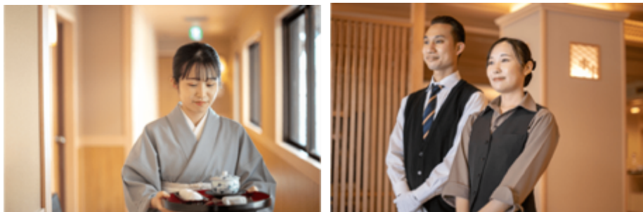
様々な取り組みにより、働きやすい職場環境へ

https://prtnews.jp/main/html/searchrhp/company_id/63789