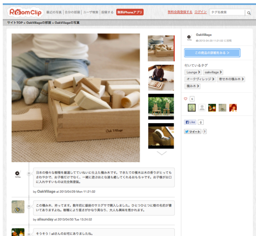
自社の製品について、ファンとのコミュニケーションができる

現在、ネット通販のベルーナと、プラスが運営する通販サイトのガラージ、木製家具のオークヴィレッジなど計4社がトライアルで公式アカウントを開設しています。月額の基本利用料は15万円。今年度中に20社程度への導入を計画しています。