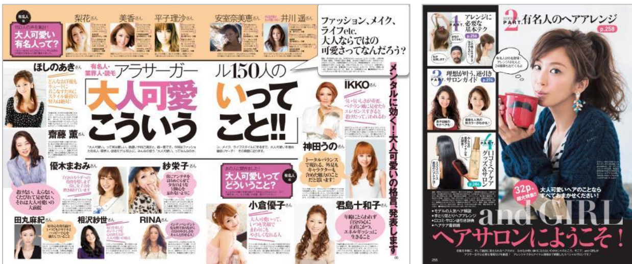
○ エムオン・エンタテインメント

特別編集コラムは、アラサー女性の気持ちが明日ちょっと軽くなるよう、テーマ毎に『andGIRL』の人気記事を厳選し、ファッション、ビューティ、ライフスタイルなどの気になる情報をお届けしてまいります。第1回となる今回は、「大人可愛い」がテーマ。『andGIRL』の人気特集から「大人可愛い」にまつわる3本をセレクトしました。大ボリュームの計61ページ分を無料で立ち読みしていただけます。また、記事の一部についてはスマートフォンで読みやすいように、コラムとして書き起こしています。特別編集コラムは全3回予定です。