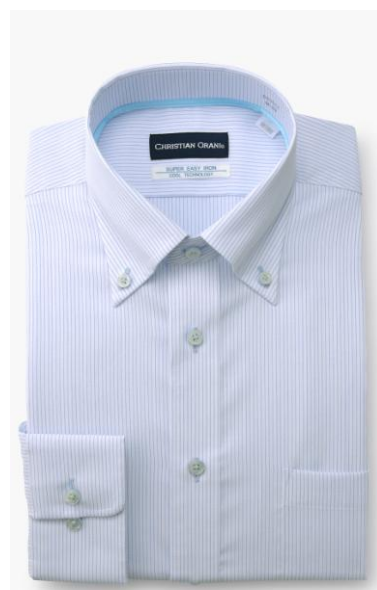
『エクストラクールシャツ』

今回、その一環として『エクストラクールシャツ』をご提案し、夏場に奮闘するビジネスマンを強かにサポートいたします。