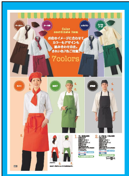
ベーカリー・レストラン ケーキ屋・ファーストフード