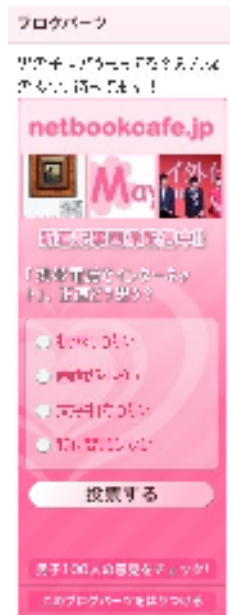
第二弾アンケート、好評受付中！

netbookcafeでは質問第2弾、「『携帯電話でインターネット』正直どう思う?」の投票を受付中！ 皆さんの投票をお待ちしております！！