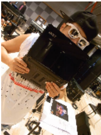
VERBAL( m-flo )