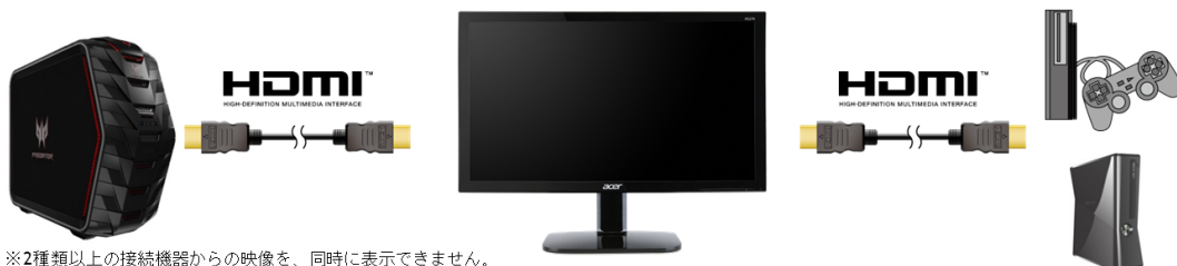
※2種類以上の接続機器からの映像を、同時に表示できません。 ※掲載の画像は接続イメージです。

家庭用ゲーム機器、Blu-ray™などの再生機器を接続できるHDMI入力端子を2ポート装備。1台のモニターで、複数の入力機器を接続し表示を切り替えて使用できます。映像と音声をHDMIケーブル1本で伝送でき、配線が簡単です。