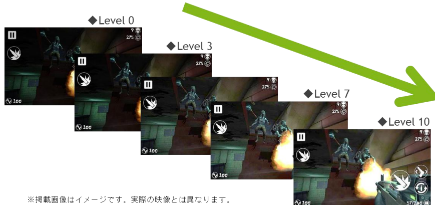
※掲載画像はイメージです。実際の映像とは異なります。

黒の強弱を調節して、暗がりの視認性を高めます。10段階から選択できるので、シーンに応じてお好みのレベルを簡単に設定できます。