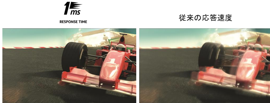
※掲載画像はイメージです。実際の映像とは異なります。

※1. OSDメニュー内のオーバードライブ機能を"Extreme"に設定した際の数値です。初期設定は2ms(GTG)です。