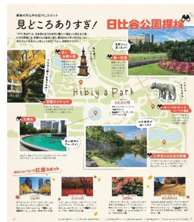
▲「アキメク！千代田」企画例