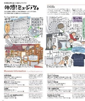
▲「アキメク！千代田」企画例