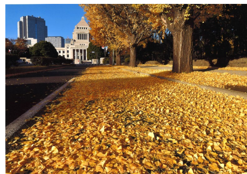
▲第3回 東京大回廊写真コンテスト入賞作品 「未来を託す道」望月和夫