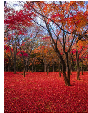
▲第2回 東京大回廊写真コンテスト入賞作品 「赤い絨毯」 神永知行