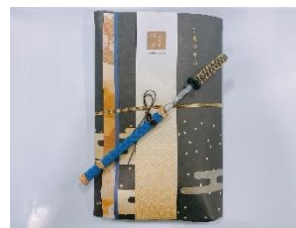
SAKURA BATH 刀剣Ver. 1,500円相当