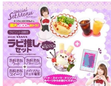
メイドカフェびなふおあ ラビリント店 ラビ推しセット 3,300円分