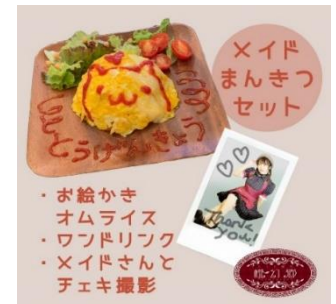
メイド喫茶橙幻郷 メイドまんきつ セット 3,200円分