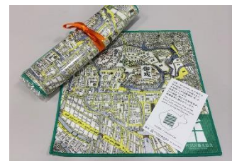
江戸城古地図ミニタオル 500円相当