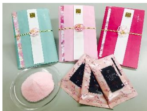
SAKURA BATH 990円相当