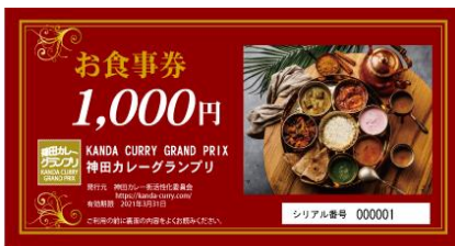
「神田カレーグランプリお食事券」 3,000円分