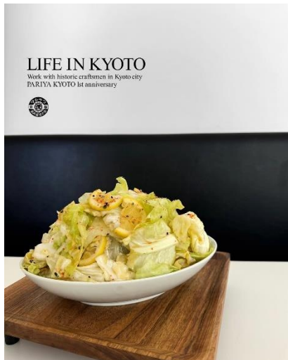
【澤井醤油本店】 ちぎりキャベツとだし醤油とレモン、 オリーブオイルのスパイシーナムル