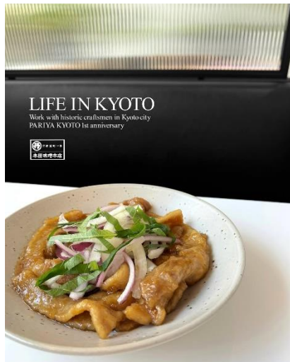
【本田味噌本店】 豚肉の赤味噌たれくし