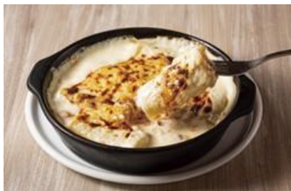
トリュフが香る！ 前沢牛を詰めた「カネロニ」