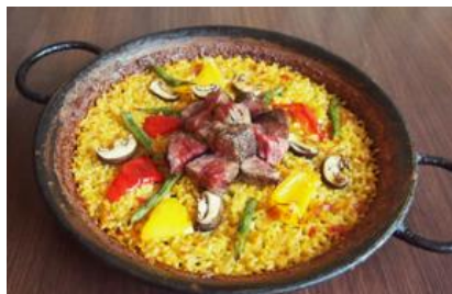
熊本県産 あか牛ステーキのパエリア

本イベントでは、濃厚な魚介だしで炊き上げたRico一番人気の「バルセロナ風シーフードパエリア」や人気のタパスのほか、 伊勢丹新宿店限定のメニューを5品ご用意。新発売となる「プレミアムパエリアプレート」 は、熊本県産あか牛「延寿牛」を贅沢に使用した 「あか牛ステーキのパエリア」と、蟹・ホタテ・海老・ムール貝・ハマグリ の5種の豪華なシーフードを使用した 「冬のごちそうパエリア」の2種が堪能できる、プレミアムな一品 です。ほかにも、臭みがなく芳醇な味わいが特徴の「スペイン産仔羊“コルデロ”のガランティーヌ」や、 赤ワインとシェリー酒であか牛をじっくり煮込んだカタルーニャ地方の伝統料理「フリカンド」 など、今回だけの特別メニューを豊富に揃えています。