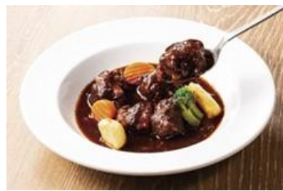
8時間じっくり煮込んだ「フリカンド」