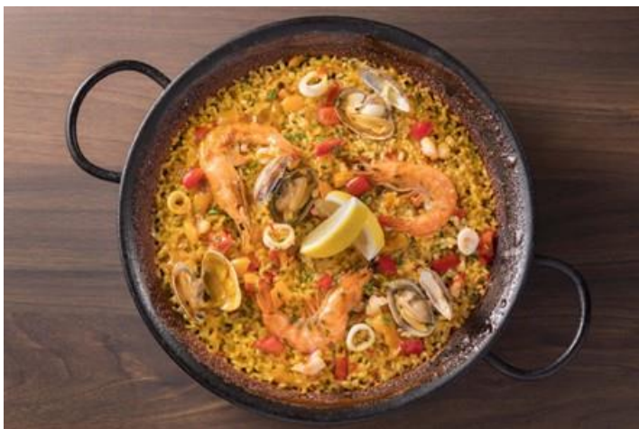
バルセロナ風シーフードパエリア

株式会社グリーンハウスフーズが運営する、東京・西新宿にある本格スペイン料理レストラン「SPANISH DINING Rico（スパニッシュダイニング リコ：以下Rico）」は、 伊勢丹新宿店本館地下1階「食料品フードコレクション」にて12月4日（水）から12月10日（火）に開催される、「Winter party food」に出店いたします。