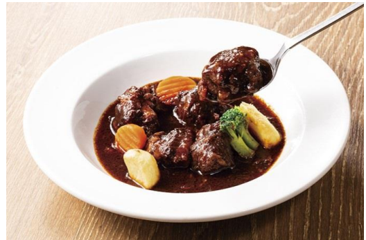
8時間じっくり煮込んだ「フリカンド」