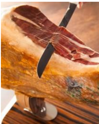
ハモン・イベリコ

今年のクリスマスは、 「Rico」が自信を持っておすすめする二夜限定の特別ディナー で、大切な方と思い出に残るひとときを過ごしてみませんか。