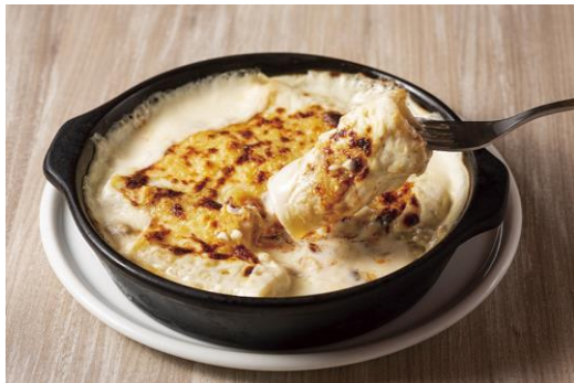
前沢牛を詰めた「カネロニ」

12月23日(月)～12月25日(水)の3日間は、「京王百貨店 新宿店」にて催事出店。 Rico一番人気の「バルセロナ風シーフードパエリア」はもちろん、前沢牛のポロネーゼを詰めたスペインのパスタ料理「カネロニ」、アンガスビーフを赤ワインとシェリー酒で8時間じっくり煮込んだカタルーニャ地方の伝統料理「フリカンド」など、 クリスマスシーズンをさらに彩るスペイン各地の伝統料理をご自宅でお楽しみいただけます。