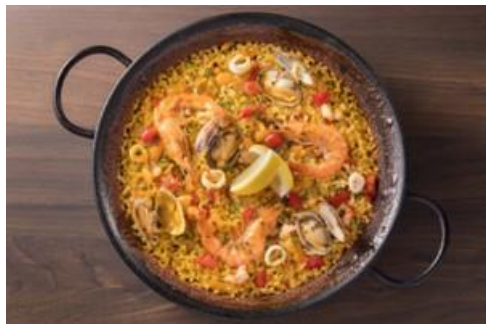
バルセロナ風シーフードパエリア