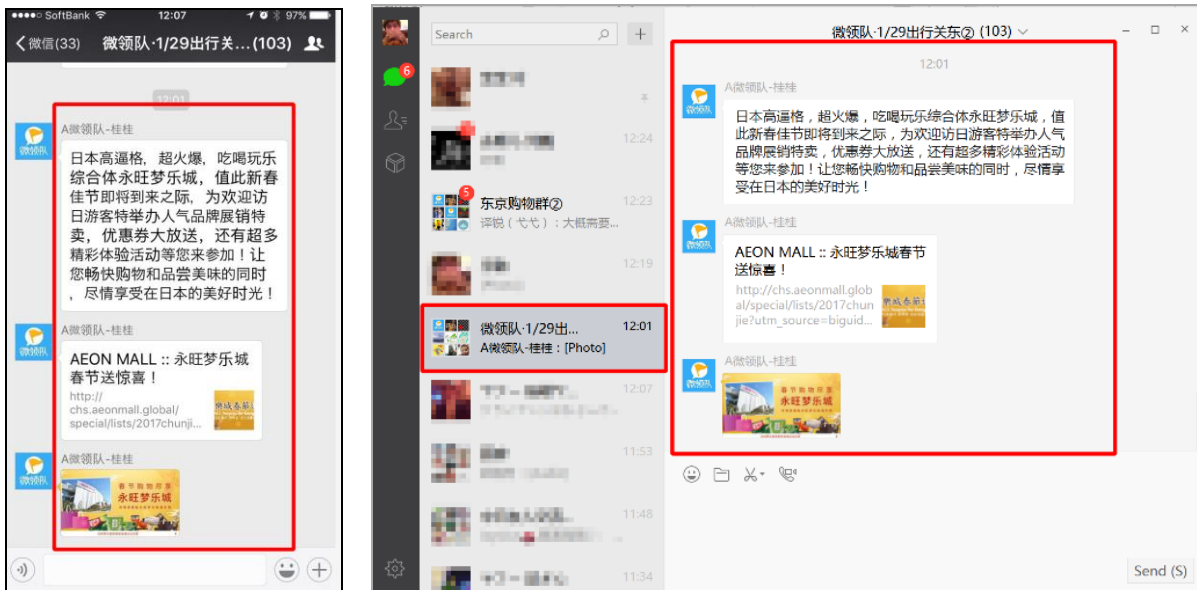
赤枠内が広告スペース：メッセージ、キャンペーンLPサイトへ遷移が可能