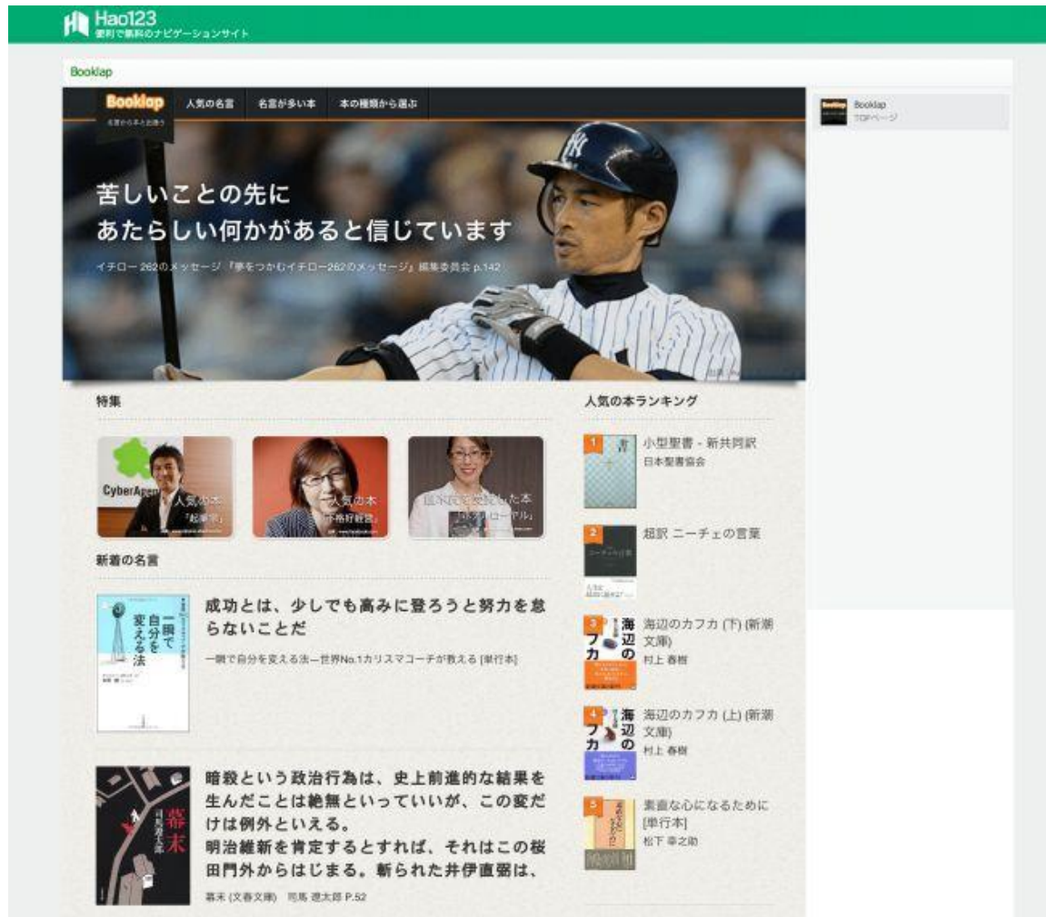
Booklap コンテントップページ