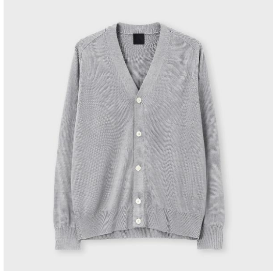
V ネックカーディガン/コネックス ¥63,800

今回のオープン記念として、ブランドの新たな定番アイテムとなるシルクニットを、阪急メンズ大阪限定カラー（シルバーグレイ）で展開します。日本産シルクの極細糸を3本取りで編み立てた、シルク特有の光沢としなやかなドレープ感が特徴の、クルーネックとVネックカーディガン2型をご用意しました。明るいカラーとクリアな素材感で、軽やかな春の装いをお楽しみください。