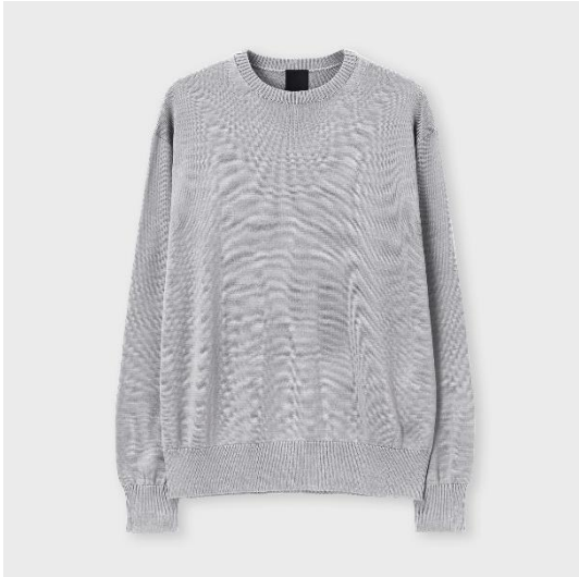
クルーネックニット/ソマレル ¥57,200