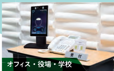
オフィス・役場・学校