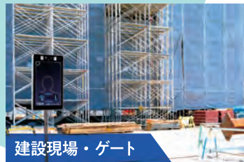
建設現場・ゲート