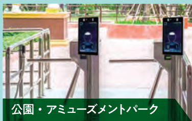
公園・アミューズメントパーク