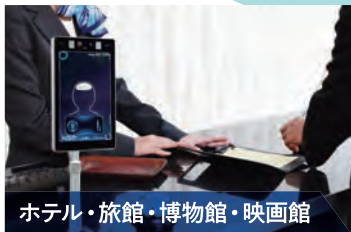
ホテル・旅館・博物館・映画館