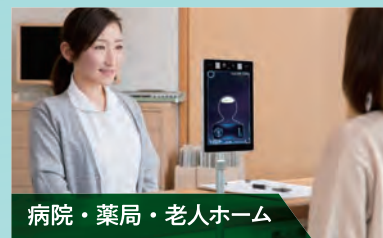
病院・薬局・老人ホーム