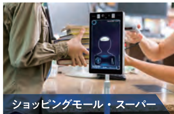
ショッピングモール・スーパー