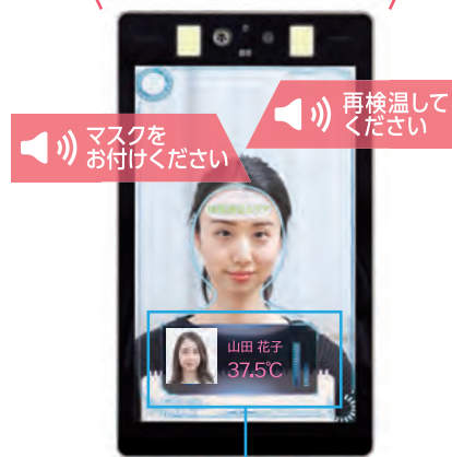
登録写真・名前を表示