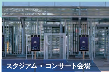
スタジアム・コンサート会場