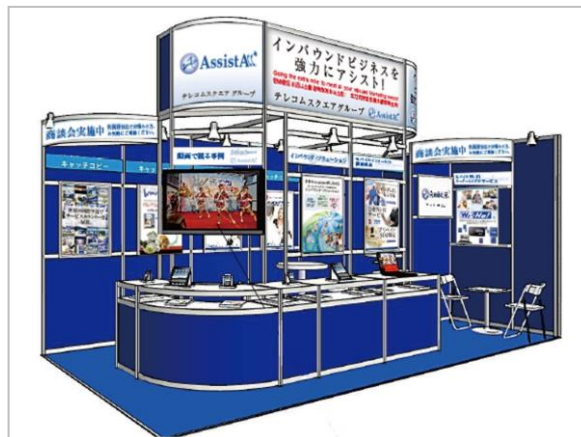
出展ブースイメージ

日本政府観光局(JNTO)によると、2014年7月の訪日は前年同月比26.6%増の127万人となり、単月では過去最高となりました。2020年の東京オリンピックに向けて、日本では、外国人旅行者誘致に向けた様々な取り組みが進められていますが、国土交通省による提言書「グローバル観光戦略」によると、訪日促進のためには旅行者へのPR・情報提供が課題とされています。