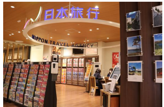
東京統括支店（パルコヤ上野支店）

TiS 博多支店（いい旅サロン九州）／笹丘支店 TiS 小倉支店／イオン穂波支店／ゆめタウン行橋支店 イオンモール佐賀大和支店