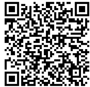
QR コード (iOS/Android 共通)