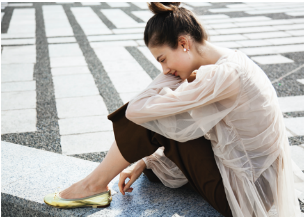
モデル着用商品：神戸牛レザーマイラーバレエシューズ（プラチナゴールド）