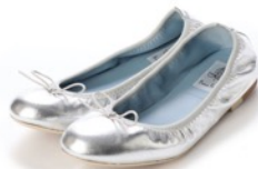
神戸牛レザーマイラーバレエシューズ 品番：EFx02p KM062 カラー：シルバー