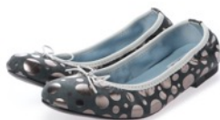
神戸牛レザー DOT柄バレエシューズ 品番：EFx02p KS502 カラー：ブラック×シルバー