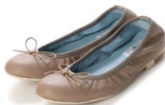
神戸牛レザースムースバレエシューズ 品番：EFx02p KP055 カラー：チャコールグレー