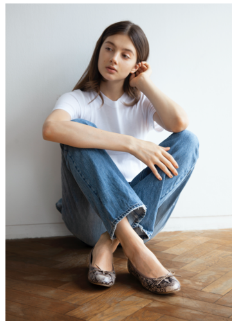
モデル着用商品：神戸牛レザーパイソン柄バレエシューズ