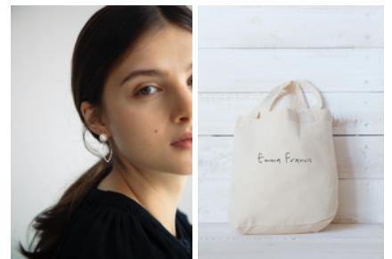
Emma Francisオリジナルピアス・エコバック

2020年 9月 2日(水)～ 9月 8日(火) 2020年 9月 2日(水)～ 9月15日(火) 2020年 9月15日(火)～ 9月22日(火) 2020年 9月30日(水)～10月13日(火)