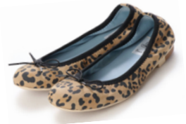
神戸牛レザー豹柄バレエシューズ 品番：EFx02p KP328 カラー：豹