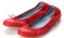
神戸牛レザースムースバレエシューズ 品番：EFx02p KP035 カラー：レッド