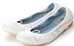
神戸牛レザースムースバレエシューズ 品番：EFx02p KP058 カラー：ホワイト