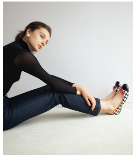
モデル着用商品：チドリ柄バレエシューズ