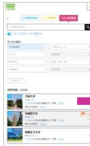
⇒ 「大学検索」機能から、就職先企業を検索 (SP版)