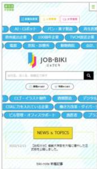
「就職先検索」機能 (SP版)