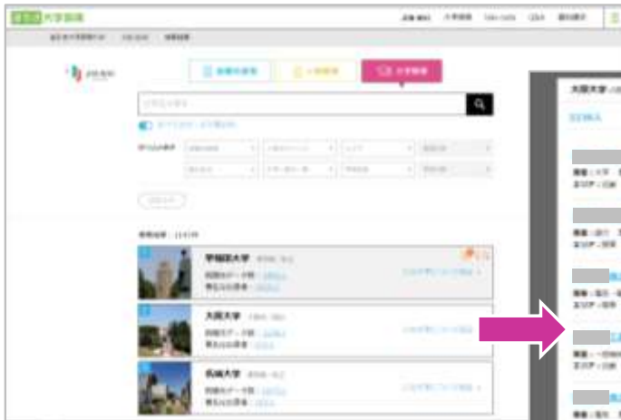
⇒ 「大学検索」機能から、就職先企業を検索 (PC版)