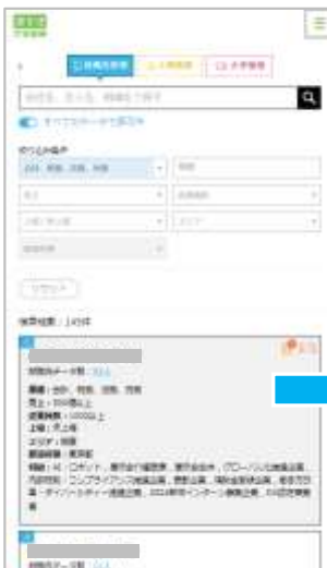
⇒ 「就職先検索」機能から、卒業大学を検索 (SP版)