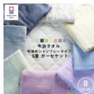
「瀬戸内ソムリエ」 今治タオル 5重ガーゼケット