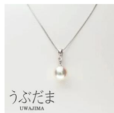
うぶだま UWAJIMA 「土居真珠」 うぶだま（真珠ペンダント）