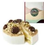
「魔法洋菓子店ソルシエ」 和菓モンブランケーキ