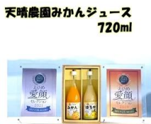
ギフト用 2本入 「愛ある愛媛いいよかん」 みかんジュースセット