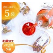
「ハーブガーデンmoco」 ハーブティセット