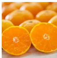
「みかんの花」 愛媛・八幡浜みかん（秀逸）

愛媛の美味しい「食」や優れた技術によって作り出される「モノ」を、より多くの方々に知って頂くために立ち上げた県産品の販促ブランドです。