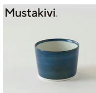
「free design」 砥部焼カップ