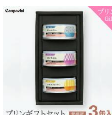
プリンギフトセット 全3色 3色入 「W-harmony」 プリンギフトセット