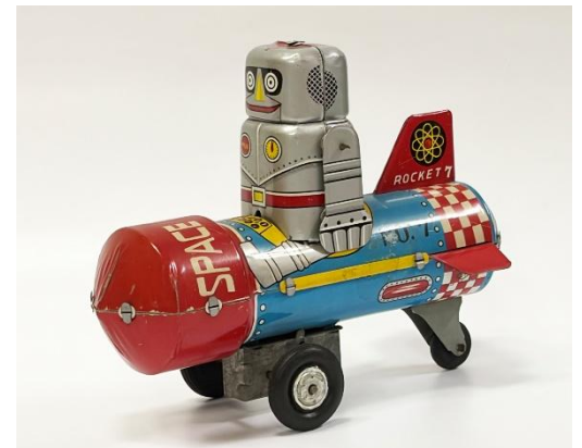
ブリキロボット「Space Robot Rocket」 1950年代 北原コレクション

北原氏の代名詞であるブリキのおもちゃをはじめ、各種コレクション資料も展示します。昭和初期に日本で発売されたブリキ製ロボット玩具の第1号とされている「Lilliput」や、昭和30年代からの世界的な宇宙開発による宇宙ブームに関連した「Space Robot Rocket」などのほか、貸本やレコード、雑誌の付録やグリコのおもちゃなど、膨大な北原コレクションの多様さも紹介します。