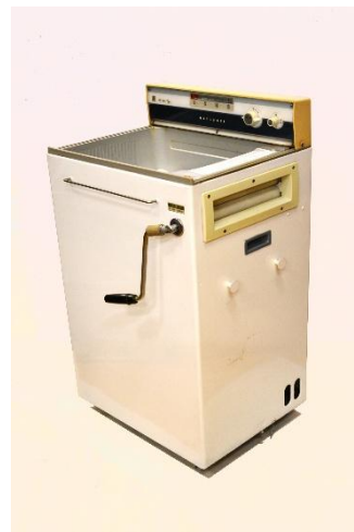
洗濯機「NATIONAL N-450—自動反転 Hi Line type」

一般家庭における文化的な豊かさの象徴とされた、白黒テレビ・電気洗濯機・電気冷蔵庫の三つの家電。これらは総称して「三種の神器」と呼ばれ、これらをそろえた暮らしが憧れになり、また生活での目標となりました。この当館が所蔵する「三種の神器」という呼び方は、昭和29年(1954)頃から言われはじめたとされ、その後、これら豊かさの象徴は「3C」とされるカラーテレビ・クーラー・車(Color TV, Cooler Car)へと変わって行きます。本展覧会ではこの「三種の神器」を展示。「三種の神器」が登場する前の時代にも思いを馳せながら当時の豊かさの象徴をご覧になってみてください。ちなみに、「三種の神器」が普及しはじめた当初、一番普及していたのは何だと思いませんか？答えは展覧会にてご確認ください。