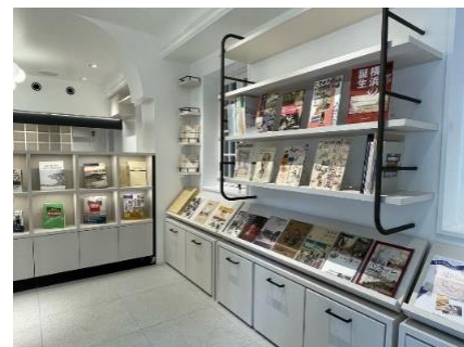
PORTER'S LODGEの店舗外観と店内

【店舗のコンセプト・主な取扱商品】 「横浜開港・英国文化を伝えるセレクトショップ」として、横浜中華街や元町商店街、山下公園通りで営業する店舗などから、横浜の歴史を伝える商品などを仕入れて販売するほか、 旧英国総領事館や英国文化を伝える商品、横浜開港の歴史を伝える資料館所蔵資料を活かしたオリジナル商品を開発販売 し、ペリーが上陸した開港の地横浜の原点から、ミュージアムショップ(買う)、カフェ(味わう)の機能を通じ、YMC地区(山下公園・横浜中華街・元町商店街)へのコンシェル(導く)を実現します。