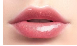
仕上がりイメージ

淡くピュアなピンクカラーに大胆に輝く粒径の大きなパールを配合。キュートさを感じるレッドパールを基調としながら、シルバー・グリーン・イエローのパールで煌めきのアクセントをプラスした、多幸福感ピンクです。