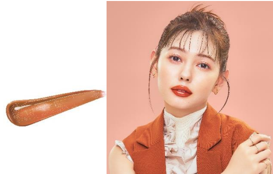
【103】ブッシュドメロウ