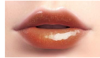
仕上がりイメージ

こなれ感のあるブリックブラウンに粒径の異なるパールを配合。イエローパールとレッドパールをメインに、大胆な輝きのシルバーと繊細に輝くオレンジパールで多彩な煌めきを演出するブラウンです。