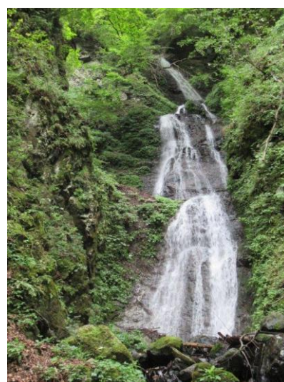
【ユネスコエコパーク内 瀬戸千段の瀧】

今後も、南アルプス市と連携・協力しながら、地域の発展・振興、美しい自然環境の保全に向け、コーセーグループ全体で推進してまいります。