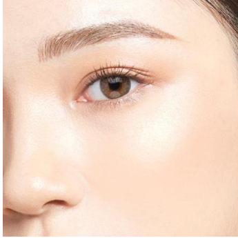
仕上がりイメージ

薄膜で重くないのに、毛穴・色ムラをしっかりカバー。どんな肌にも馴染み、自然にトーンアップします。さらに、SPF40/PA+++で紫外線によるダメージから肌を守ります。