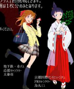
地下鉄・市バス 必須チケット 太秦萌

※イベント当日の【地下鉄・嵐電1dayチケット】のご提示で、 入場料金から100円引きになります。