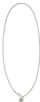
BONEE × CONZ LOOP LOOP NECKLACE LONG 75,900円(税込)