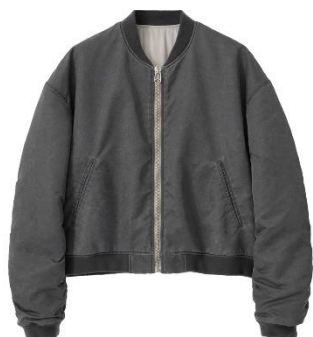
soe × CONZ Faded Bomber Jacket 80,300円(税込)