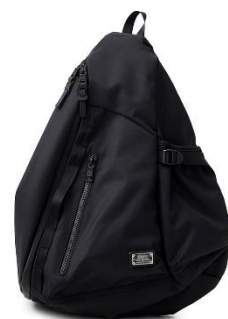
AS20V × CONZ sling bag 22,000円(税込)