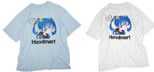
HOODMART × CONZ 9,900円(税込)