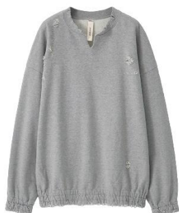
SHINYA KOZUKA × CONZ HOME BAGGY 30,800円(税込)