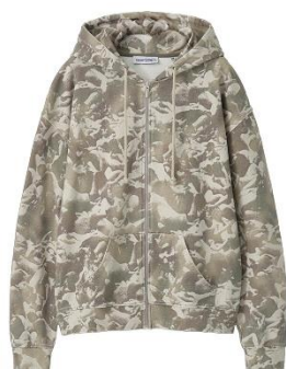
carne bollente × CONZ Carne Camo ZIP HOODY 35,200円(税込)