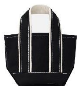
KOOKY ZOO × CONZ DINKY BAG 15,400円(税込)