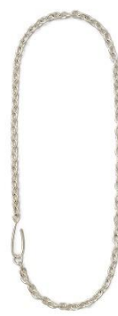
BONEE × CONZ BALL & HOOK -50 31,900円(税込)