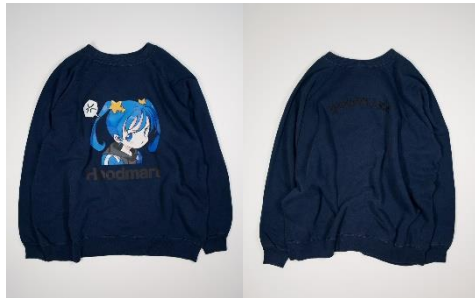
HOODMART × CONZ 13,200円(税込)