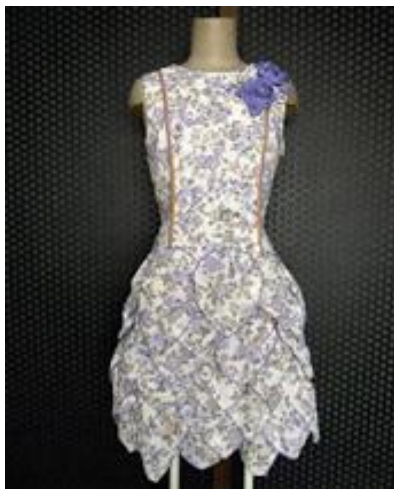
前回の最優秀作品賞

コンテスト詳細は下記 URL をご参照ください。 http://cafe.crafttown.jp/