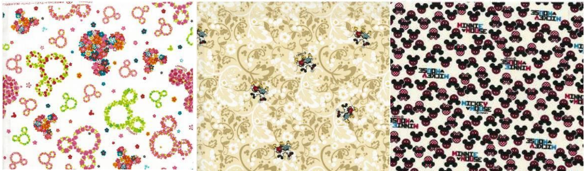
O・TO・NA ディズニー生地