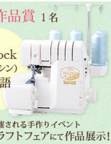
今回の最優秀作品賞品