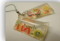
ソフトタイプは袋にいれて成形したり、紙類を固めたりすることもできます