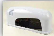
UVレジン照射器とUVレジン液

紫外線によって固まる1液タイプのレジンです。UV照射器で紫外線を当てて数分で硬化させることができます。照射器がない場合は太陽光で硬化させることもできます。UVが届く2cmくらいまでの厚さの小さなパーツ作りに向きます。