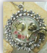
立体的なパーツを入れることもできます