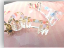
厚みのある作品に向きます