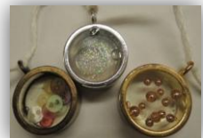
ハードタイプはフレームに