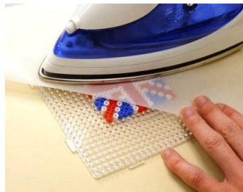
アイロンで固める