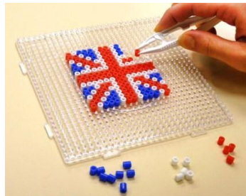
プレートにならべて