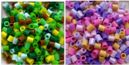
色とりどりのビーズを