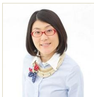
光浦靖子(タレント)