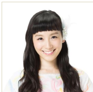
篠原ともえ(タレント・アーティスト)

今回の『ハンドメイド大賞』では、衣装デザイナーとして注目を集めている篠原ともえさんや、自らの手芸作品を収めた書籍『男子がもらって困るブローチ集』などが話題の光浦靖子さん、彫刻家として雑誌連載をもつ片桐仁さんといったデザインやアート、ハンドメイド業界の著名人 7 名にゲスト審査員として、作品の審査にご参加いただく予定です。