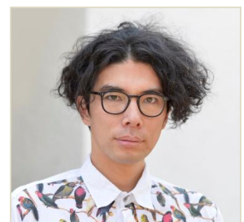
片桐 仁(俳優・彫刻家)